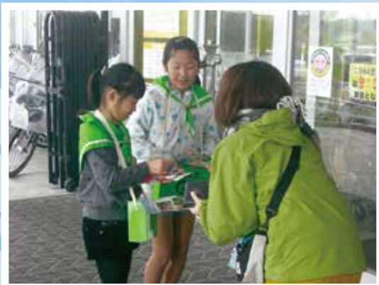
緑の募金活動風景(鳥取市立賀露小学校みどりの少年団)

「緑の募金」は県内の森林整備・緑化をはじめ、 東日本震災地域の森林復旧や全国の森林整備、 森林ボランティアの育成に、大切に活用されています。