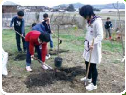
湯梨浜町立羽合小学校 (校地内に子どもたちが実のなる木を植えました)