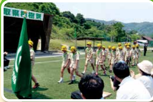
第59回鳥取県植樹祭に参加する みどりの少年団

皆さまの善意によって 寄せられた「緑の募金」は、 緑豊かな潤いのある 森林・緑づくりに 活用されています。