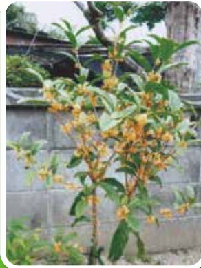
誕生記念樹贈呈のキンモクセイ (1年後、きれいに咲きました。)