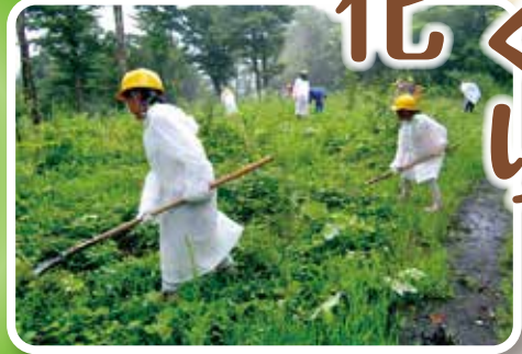
みどりの少年団交流集會下草刈り作業 (第64回全国植樹祭植樹會場 とっとり花回廊「いやしの森」)

皆さまの善意によって 寄せられた「緑の募金」は、 緑豊かな潤いのある 森林・緑づくりに 活用されています。